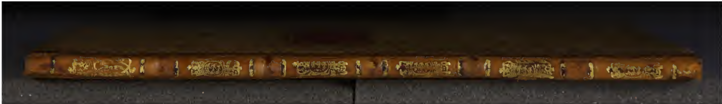
Early European Books, Copyright © 2009 ProQuest LLC. Images reproduced by courtesy of the Royal Library, Copenhagen. LN 1106 4°